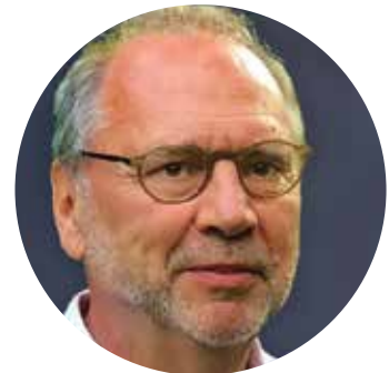
Président du Conseil Scientifique de l'Institut Pasteur de Dakar et du Conseil Stratégique du Pasteur Network Prof Peter Piot