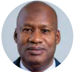
Ministre de la Santé et de l'Action Sociale Dr Ibrahim SY