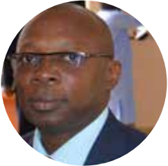
Chargé de Recherche et Représentant de l'OOAS Pr Issiaka SOMBIE