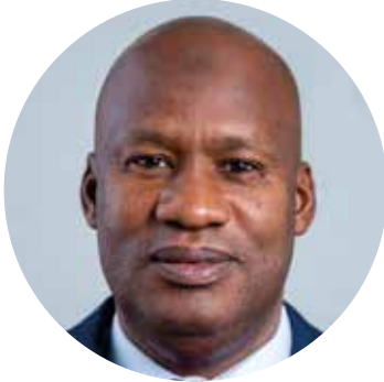
Ministre de la santé et de l'action sociale , Seneal Dr Ibrahima SY